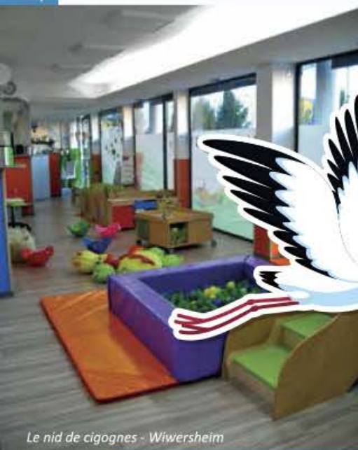
Le nid de cigognes - Wiwersheim

Transmettre, partager, échanger des connaissances... des mots simples qui définissent un concept de qualité : celui de l'accueil du réseau Les Crèches de Tilio. Il favorise l'éveil, l'épanouissement et le bien être de votre enfant. Entrez avec nous dans un monde serein et sécurisé construit pour développer tous les aspects de la croissance de votre enfant : Tilio.