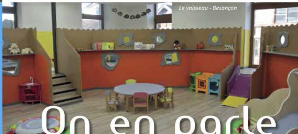
Le vaisseau - Besançon

Choisir une structure de petite taille vous assure le bon développement de votre enfant qui pourra ainsi évoluer à son rythme. Fournir une qualité d'accueil à votre enfant et garantir le respect de son rythme, voici les objectifs de notre réseau.